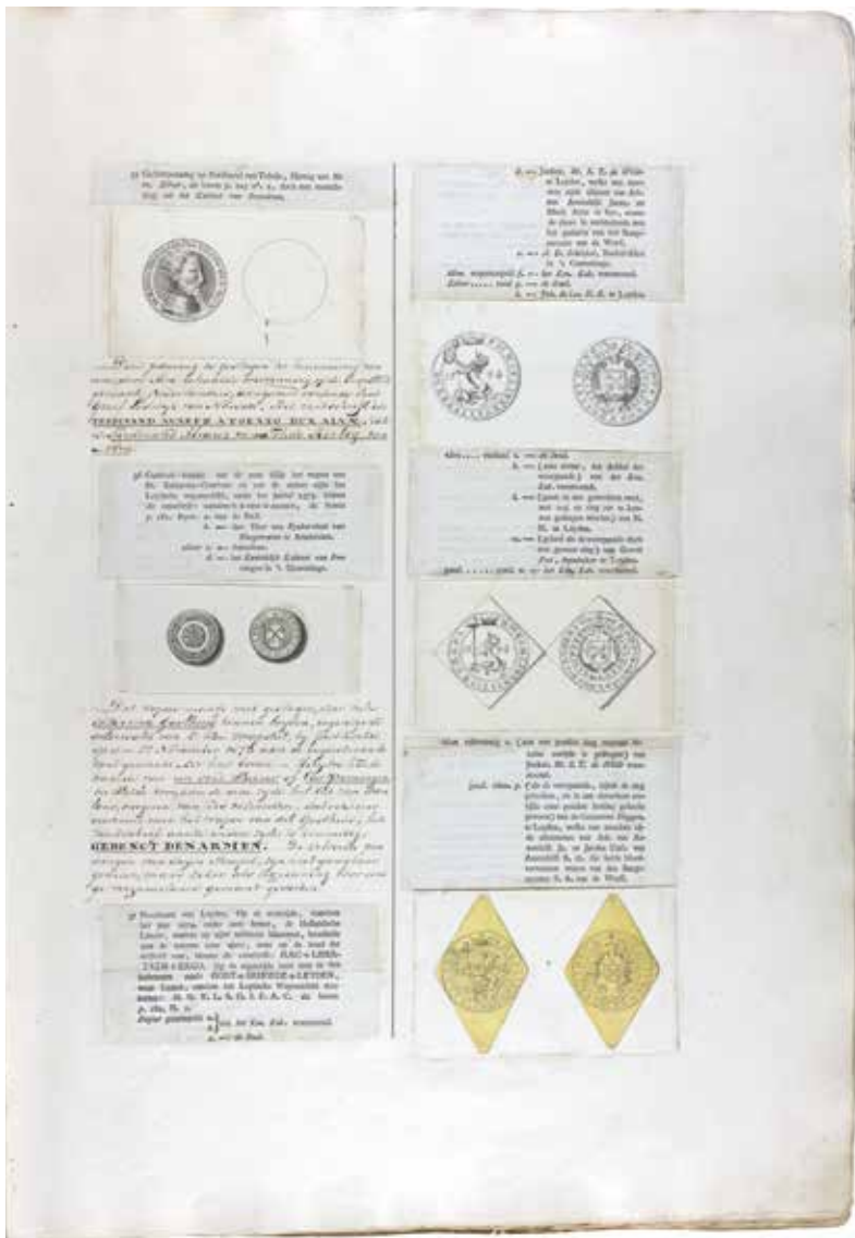
4. Salomon van der Paauw, Aftekening van de aan Van der Werf vereerde gouden gedenkpenning in de vorm van de Leidse noodmunt, in: Catalogus van oudheden en bijzonderheden, betreffende het beleg en ontzet der stad Leyden, 1824 , Erfgoed Leiden en Omstreken, Leiden.