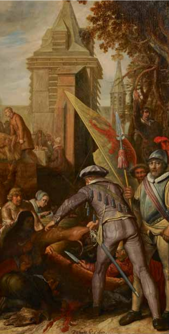
5. Joris van Schooten, De gevolgen van de hongersnood tijdens het beleg , 1643, doek, 181 x 232,5 cm, De Lakenhal, Leiden.