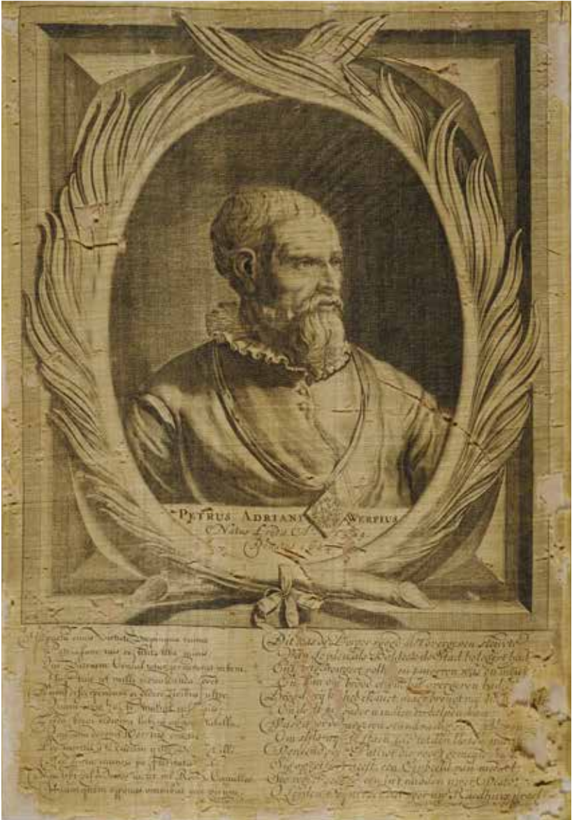
7. Pieter Philippe, Gegraveerd portret van Pieter Adriaensz van der Werf , afgedrukt op goudkleurige zijde, 40,5 x 28,1 cm, De Lakenhal, Leiden.