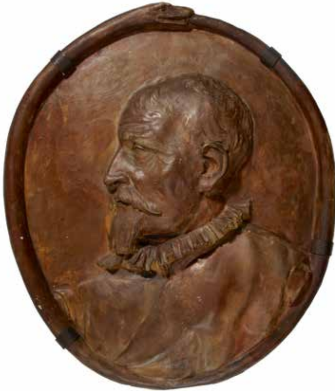
6. (Rombout Verhulst?), Medaillon met portret van Pieter Adriaensz van der Werf, 1660-1661? , terracotta, 54 x 46,3 cm x 7,7 cm, ovaal, De Lakenhal, Leiden.