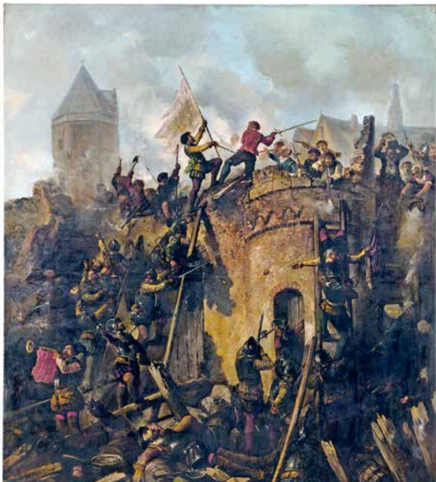
16. Herman Frederik Carel ten Kate, Bestorming van Alkmaar op 18 september 1573 , 1862, olieverf op doek, 195 x 175 cm (Stedelijk Museum Alkmaar).