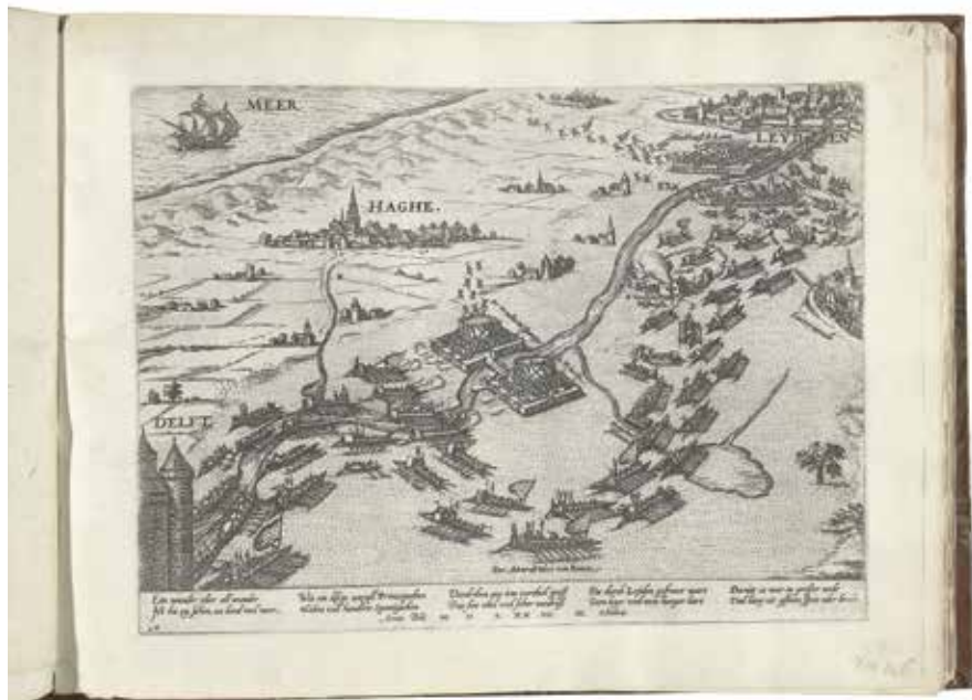
18. Frans Hogenberg, Beleg van Leiden in 1574, 1574, ets , ca. 21 x 28 cm (Rijksmuseum, Amsterdam).

van Leiden: een klein werk waarop afgebeeld is hoe een vrouw als een ware Kenau (of Trijn!) strijdustig de driekleur zwaait bij de Leidse stadsmuur (afb. 19), en een kolossaal doek waarop verbeeld is hoe burgemeester Van der Werff de hongerige menigte zijn lichaam als voedsel aanbiedt (afb. 20).