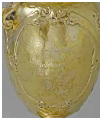
5. Adam van Vianen, Lampetkan en schaal met belegeringen, veld- en zeeslagen uit de Tachtigjarige Oorlog , 1614, zilver, schaal: 52,5 cm diam., kan: 38,5 x 17 cm (Rijksmuseum, Amsterdam, bruikleen van de gemeente Amsterdam).