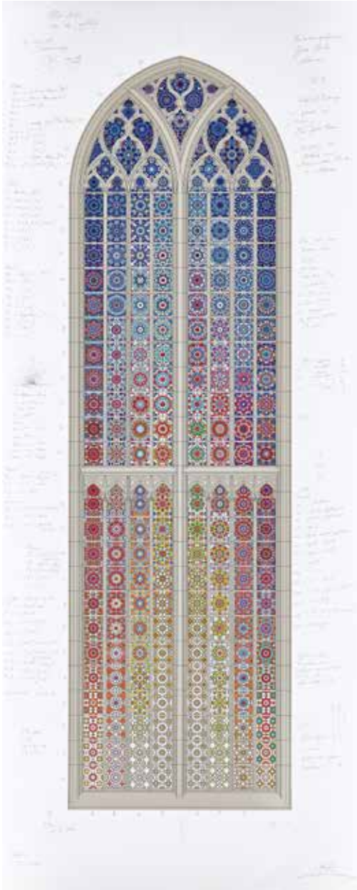
22. Fiona Tan, Het licht van de vrijheid , 2023, definitief ontwerp voor het raam in het zuidtransept van de Grote Kerk te Alkmaar met aantekeningen van de kunstenaar, 125 x 50 cm (Stedelijk Museum Alkmaar).