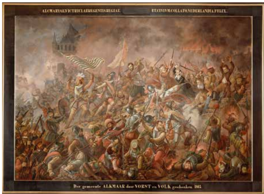
17. Jacobus W.A. Hilverdink, Bestorming van Alkmaar op 18 september 1573 , 1863, olieverf op doek, 475 x 323 cm (Stedelijk Museum Alkmaar).

Nieuwsprenten en boekillustraties van belegeringen en veldslagen werden aan de lopende band vervaardigd tijdens de Tachtigjarige Oorlog, de eerste oorlog waarvan massaal verslag werd gedaan in drukwerk. 41 Zo bracht Hogenberg na afloop van het beleg van Leiden daarover eveneens een nieuwsprent uit (afb. 18). En ook documentaire schilderijen en verbeeldingen van wapenfeiten in zilver zijn geen exclusief Alkmaars verschijnsel. Alle vroege voorstellingen van het beleg van Alkmaar passen volledig in de militaire beeldtraditie van die tijd, waarin steden onder vuur meestal van buitenaf en vaak nogal cartografisch vanaf een relatief hoog standpunt werden weergegeven. 42