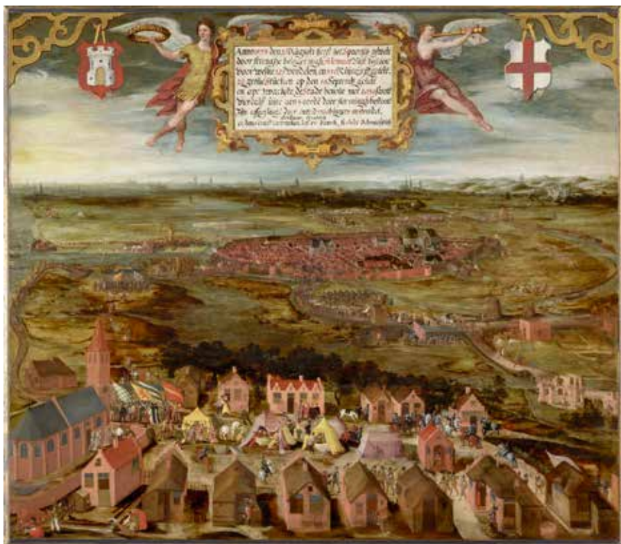
9. Kunstenaar onbekend, Beleg van Alkmaar in 1573 , 1603, olieverf op paneel, 160,3 x 187,3 cm (Stedelijk Museum Alkmaar).

blik heel speciaal, maar zijn niet uitzonderlijk in de beeldtraditie van belegeringen rond 1600. Kunstenaars die gespecialiseerd waren in legervoorstellingen namen ze geregeld op in hun schilderijen. 38