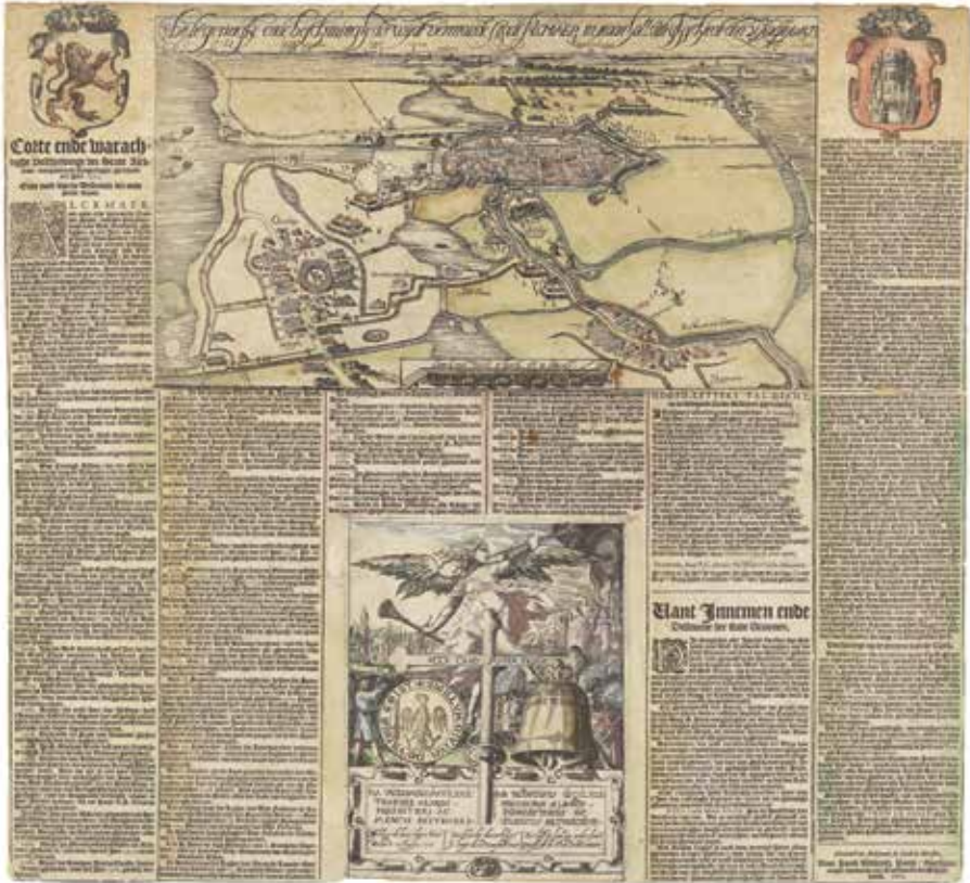
11. Prentmaker onbekend, Beleg van Alkmaar in 1573 , Alkmaar: Jacob Willemsz Paets 1607, etsen en gedrukte tekst, 49,4 x 53,6 cm (Atlas Van Stolk, Rotterdam).

de overval van Alkmaarders op de schuit buiten de stad te zien, die op 5 oktober 1573 plaatsvond.