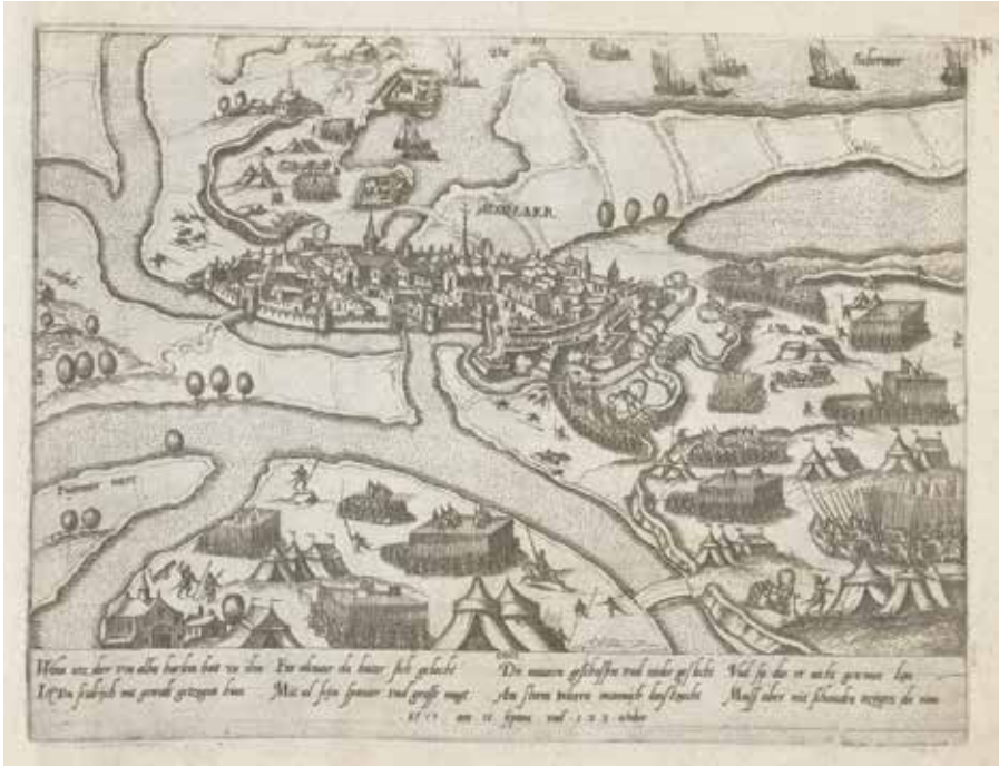
4. Prentmaker onbekend, Beleg van Alkmaar in 1573 , 1573, ets, ca. 24 x 31 cm (Rijksmuseum, Amsterdam).

Hogenberg en zijn anonieme Duitse collega komt de eer toe het historische kerngegeven van het beleg van Alkmaar – de mislukte bestorming van 18 september – als eerste in beeld gerapporteerd te hebben. Die informatie en hun kennis van het stadsbeeld hadden zij echter duidelijk alleen van horen-zeggen. Ze hebben ongetwijfeld geen schetskaartjes of andersoortig gedetailleerd en actueel bronnenmateriaal tot hun beschikking gehad. Grote historisch-topografische gebreken waren het gevolg.