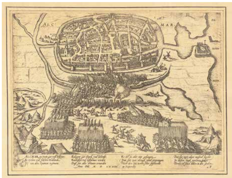
3. Frans Hogenberg, Beleg van Alkmaar in 1573, 1573, ets , ca. 21 x 28 cm (Stedelijk Museum Alkmaar).

en kaartmakers. Getrainde journalisten bestonden nog niet, al onderhielden nieuwsprentmakers vaak wel contacten met mensen ter plaatse om betrouwbare informatie te verkrijgen. Een enkeling reisde zelfs als embedded journalist mee met een leger om zelf schetsen van de gebeurtenissen te maken.