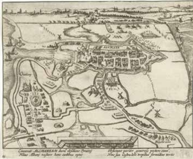
12. Simon Frisius, Beleg van Alkmaar in 1573 , illustratie uit W. Baudartius, De Nassausche oorloghen (Amsterdam 1615) (Rijksmuseum, Amsterdam).