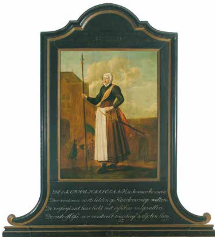
15. Kunstenaar onbekend, Portret van Kenau Simonsdr Hasselaer (1526-1588), ca. 1580, olieverf op paneel, 84 x 63 cm (Frans Hals Museum, Haarlem;).