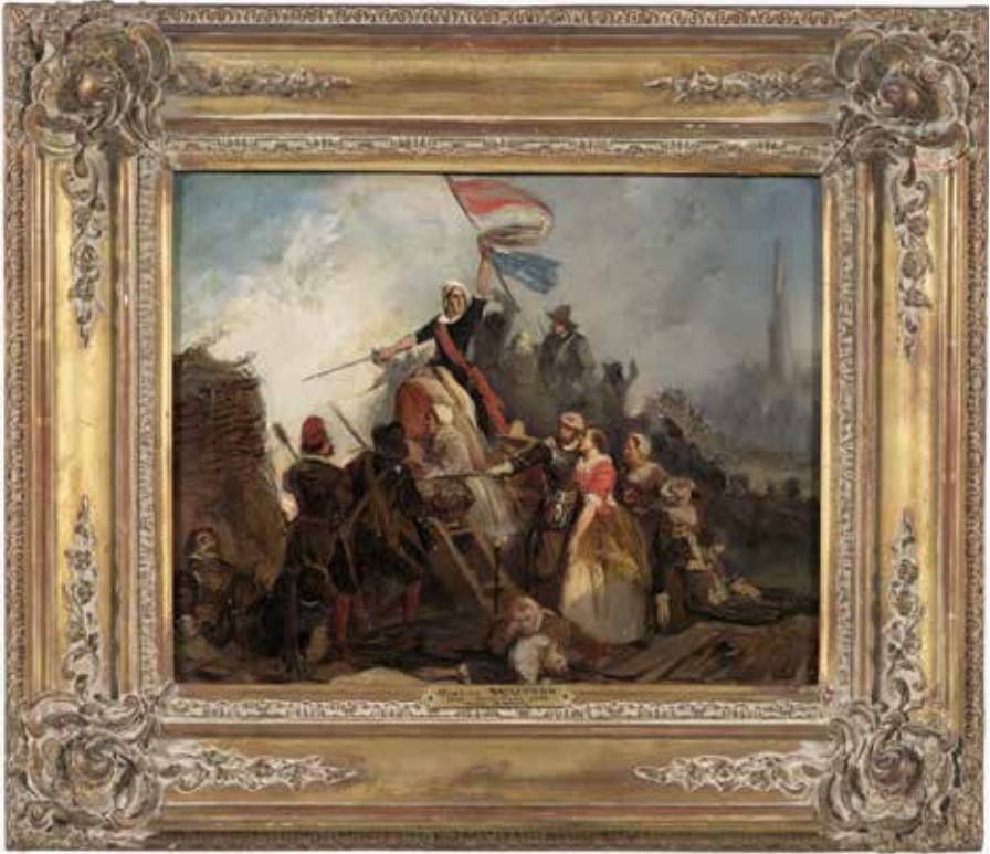
19. Gustaf Wappers, Beleg van Leiden in 1574 , ca. 1830, olieverf op doek, 40,5 x 31,5 cm (Leiden, Museum De Lakenhal).

Kerk, waarbij passages uit Van Foreests ooggetuigenverslag werden gelezen. 46 Katholieken zullen er geen deel aan genomen hebben en er zeker geen feestelijk gevoel bij gehad hebben. Zij behoorden immers sinds het ontzet tot een onderdrukte groep.