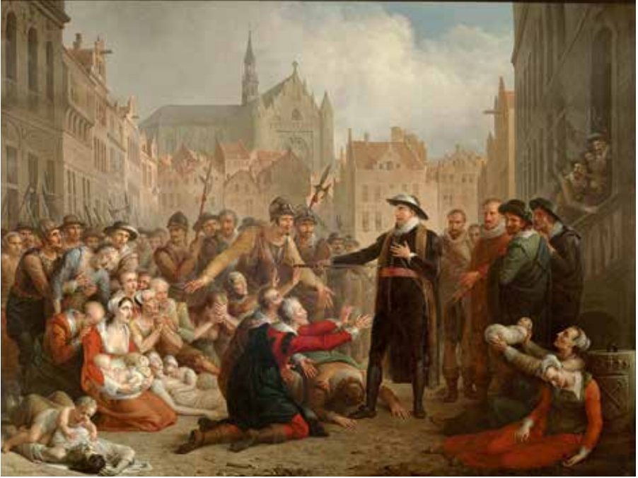
20. Mattheus Ignatius van Bree, De zelfopoffering van burgemeester Pieter van der Werff , 1816-1817, olieverf op doek, 430 x 574 cm (Leiden, Museum De Lakenhal).

vermaak en zeker het vuurwerk op 8 oktober steeds meer uit de hand liepen, besloot het stadsbestuur in december 1785 om de ontzetviering helemaal af te schaffen. In de Franse tijd was die echter alweer terug. De aanleiding voor de festiviteiten werd wel wat verbreed: men herdacht niet alleen de overwinning op de Spaanse troepen op 8 oktober 1573 maar ook die op het Engelse leger op 8 oktober 1799. Na 1813 lijkt er echter een tijdlang geen feest gevierd te zijn op 8 oktober.