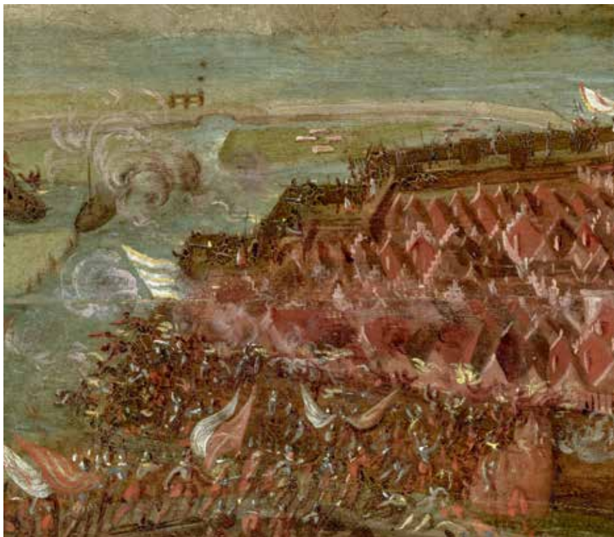
10. Vrouwen met rode rokken en witte schorten op de stadsmuren van Alkmaar (detail van afb. 9).

Hoofdonderwerp van het anonieme schilderij is, net als bij de prenten en andere schilderijen, de bestorming van 18 september. En ook deze schilder heeft heel goed geweten hoe het er precies aan toe was gegaan. Het geschut bij de Rode Toren en de Friese poort, de stormlopen op die twee punten en de verdedigers die zich op de muren fel verweren zijn allemaal goed te herkennen. Wie op de details inzoomt ziet zelfs de rode rokken met witte schorten van de moedige vrouwen (afb. 10). Aan de andere, zuidelijke zijde van de stad is met enige moeite de stormbrug te ontwaren die de regeringstroepen naar de Kennemerpoort droegen bij wijze van schijnaanval.