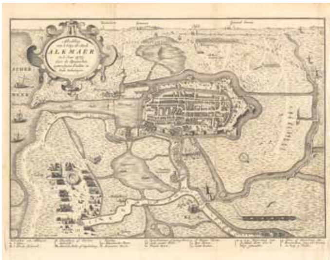
13. Jan Casper Philips, Beleg van Alkmaar in 1573 , illustratie uit W. Boomkamp, Alkmaar en deszelfs geschiedenis (Rotterdam 1747) (Stedelijk Museum Alkmaar).