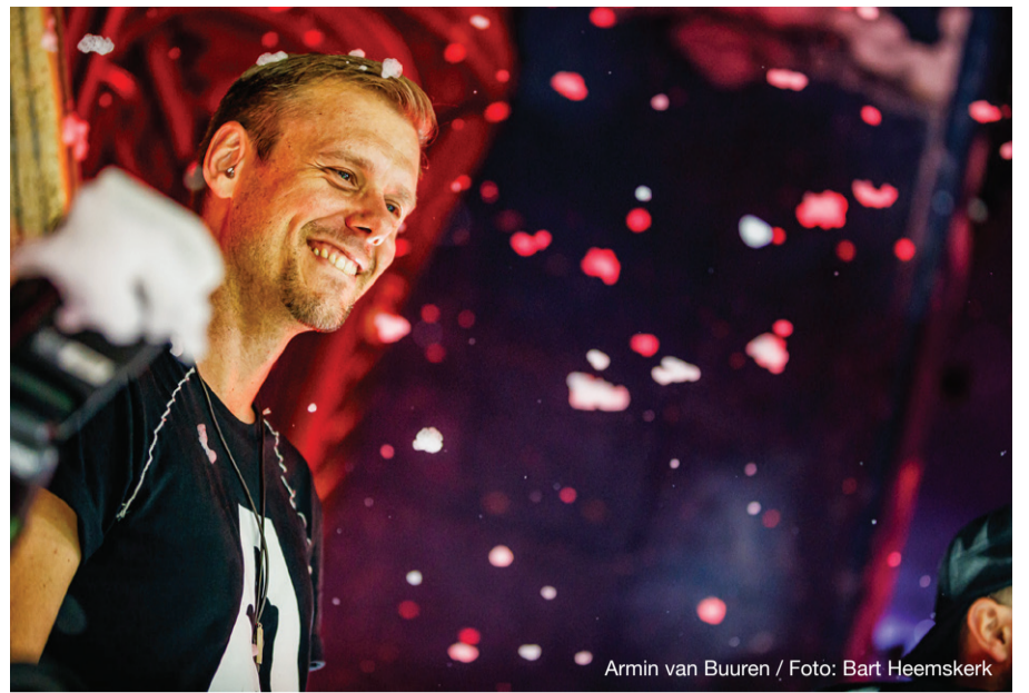
Armin van Buuren

Maanden van overleg gingen er vooraf aan de show, want een optreden van Armin tijdens Leidens Ontzet is gemakkelijker gezegd dan gedaan. ‘Leiden heeft zéker op 2 en 3 oktober geen plein waar je dit even doet. En dan is er nog de veiligheid. Er zijn