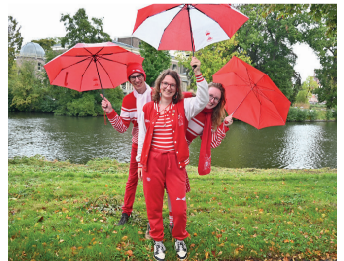
Drie van de winnaars van 2023.

De wedstrijd, alweer zo’n 15 jaar geleden bedacht door Frits Rijkse en Henny Buschman, heeft succes. Van Aelst: ‘We zien dat steeds meer mensen hun best doen om in het rood-wit langs de route te staan. Ik herken inmiddels de vaste klanten, die vaak ook op hun vaste plek langs de route staan.’ Maakte je in de eerste jaren nog wel kans op een prijs met een rood sjaaltje en een wit petje, dat is allang niet meer zo. ‘Mensen moeten echt helemaal rood-wit en origineel gekleed gaan. En je krijgt bonuspunten als je zelf iets hebt gemaakt’, aldus Van Aelst. □