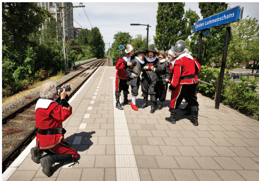
De amateurfotografen aan het werk.

Leiden Ze trokken heel wat bekijks, de Spanjaarden die deze zomer per trein bij Schans Lammen aankwamen. Reizigers bleven lachend staan, maakten filmpjes en selfies van het tafereel. De opmerkelijke scène hoort bij een fotoproject van ExpoFotoLeiden (EFL). Zij legden ‘iconen van Leidens Ontzet’ vast, maar dan met een moderne twist. De onafscheidelijke vrienden Janus Dousa en Jan van Hout in spijkerbroek en met tatoeages bijvoorbeeld.