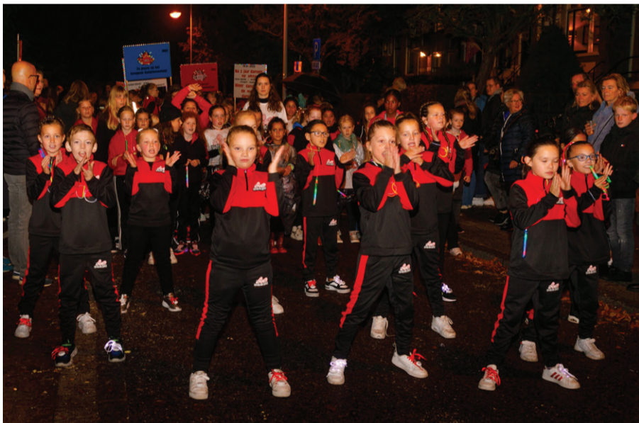
De Rode Sneakerz tijdens de Taptoe van vorig jaar.

Armin is er klaar voor, net als de gastartiesten die tijdens zijn show voorbij zullen komen. ‘Nee, ik ga nog niet zeggen wie, dat is een verrassing. Houd het er maar op dat het een goed Leids feestje zal worden, dan weet je misschien wel in welke hoek je het moet zoeken. Als Leidenaar moet je dit evenement echt niet missen. Ik ben trots op mijn stadje, en ik trek alles uit de kast om Leiden even de mooiste stad op aarde te maken. Als het dat niet al is.’ □