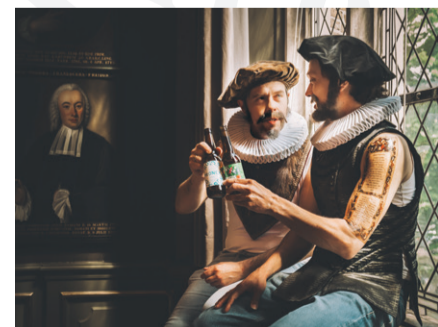
De vrienden Janus Dousa en Jan van Hout zetten zich samen in voor de verdediging van de stad. Jan van Hout schreef voor Dousa het gedicht ‘Vruntschap’. Tegenwoordig hadden deze matties daar ongetwijfeld een tattoo van laten zetten en een Leids biertje op gedronken.